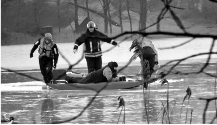
Rubikių ežere įlūžęs žvejas gelbėtojus išsikvietė pats.

Vakar, gruodžio 29-ąją, ugniagesiai-gelbėtojai iš Rubikių ežero ištraukė žveją. Dalis ežero vakar dar buvo padengta ledu, dalyje jau teliuškavo vanduo. Pagalbą pats telefonu išsikvietęs žvejys plaukė valtimi, tačiau kažkokiu būdu ir jis, ir jo valtis atsidūrė ant ledo, kuris įlūžo.