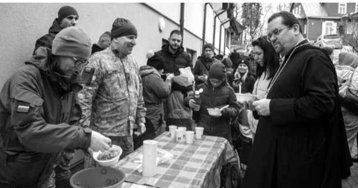
Kareiviškos vaišės ukrainiečiams Šv. Kalėdų proga.

Gruodžio 26 dieną, vyko šv. Kalėdų liturgija ukrainiečių kalba nuo karo pabėgusiems, Anykščių krašte apsigyvenusiems ukrainiečiams.