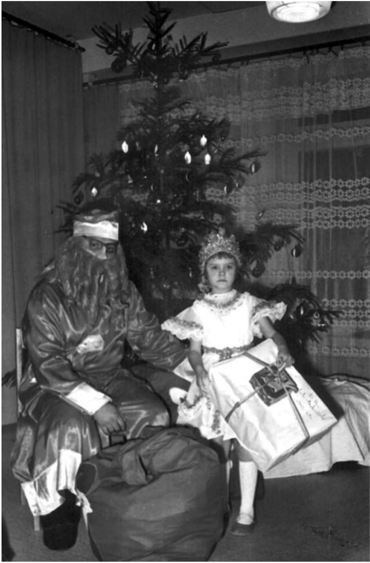
Pats gražiausias laikas, kai vaikai tiki Kalėdų Seneliu ir gauna iš jo dovanų...