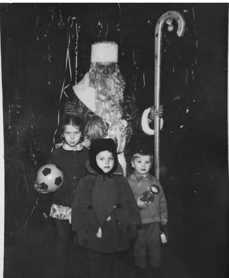
Dovanėlės iš Kalėdų Senelio rankų – prisiminimas ilgam...