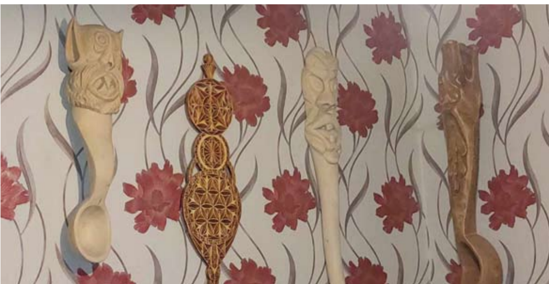
Virgilijus Aloyzas Milaknis yra pagaminęs 4–5 tūkst. dirbinių iš medžio – tarp jų šaukštų ir vepsčių.