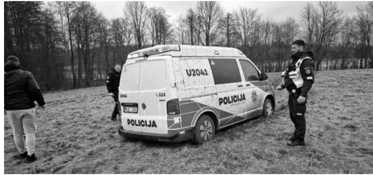
Policijos automobiliui taip pat prireikė pagalbos.

Ištraukus vyriškį iš ežero, gelbėjimo operacija nesibaigė. Iš penkių specialiųjų tarnybų ekipažų (greitoji, policija, 3 „gais-