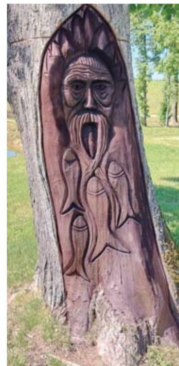
Naujam gyvenimui prikeltas nudžiūvęs medis.

„Dirbdamas su medžiu, negali daryti klaidų, kažką ne taip padrožęs, sunkiai atgal bepriklijuosi“, – kalbėjo tautodailininkas.